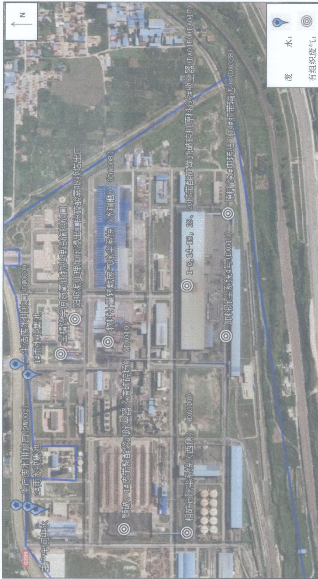
附图（一） 检测点位布置图