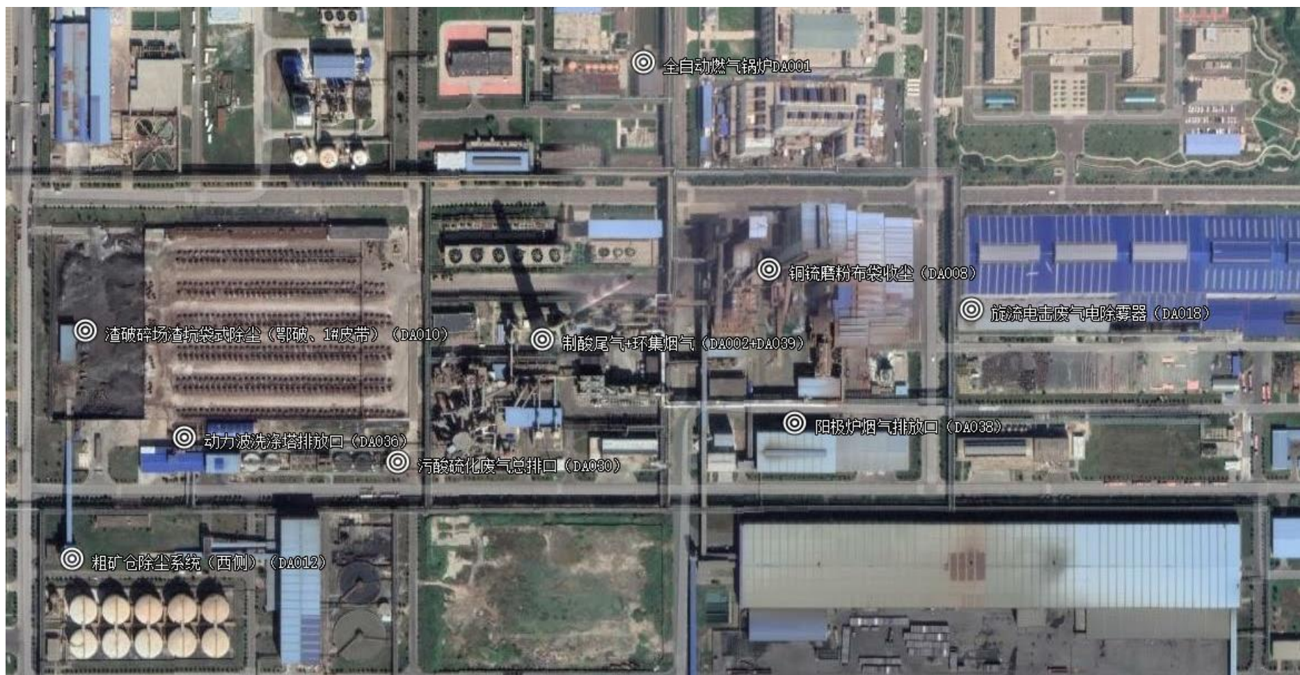
附图2-1 (2) 有组织废气监测点位布置图