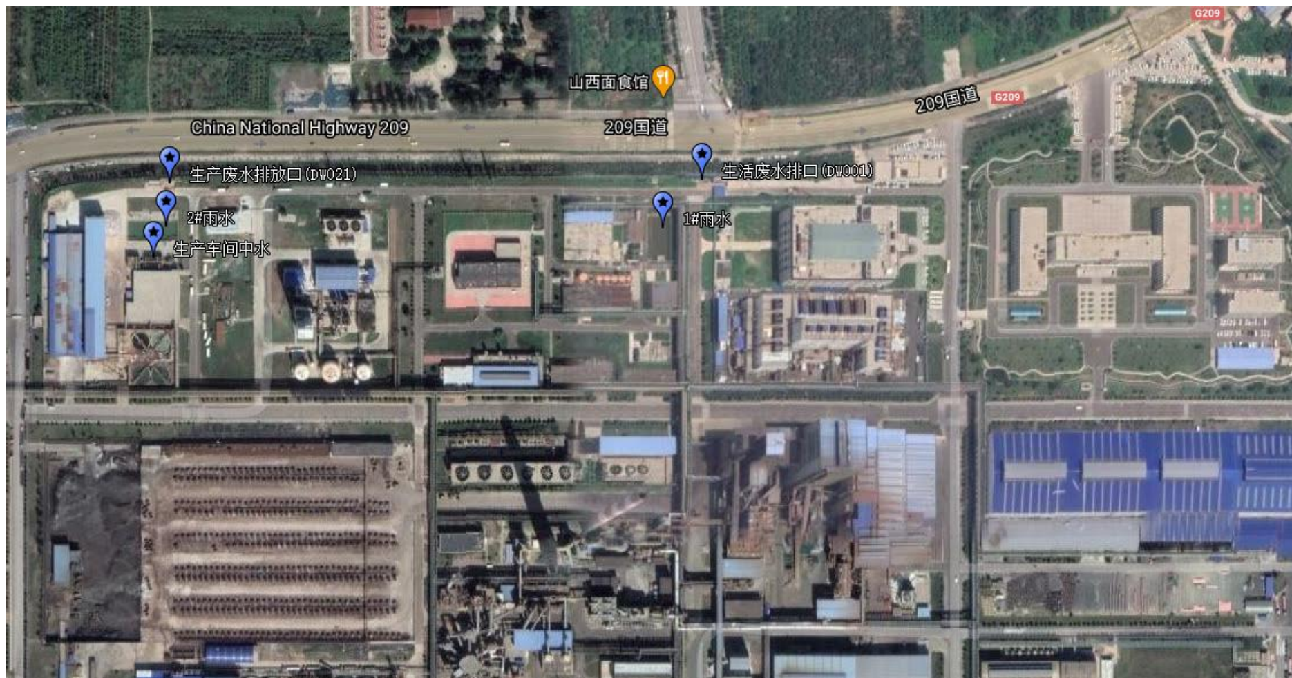
附图2-3 废水监测点位布置图