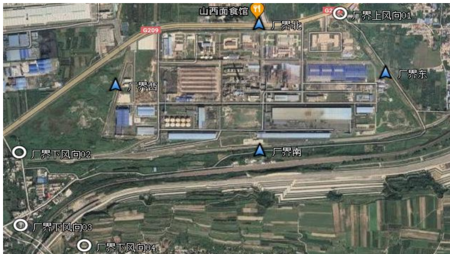
附图2-2无组织废气、厂界噪声监测点位布置图