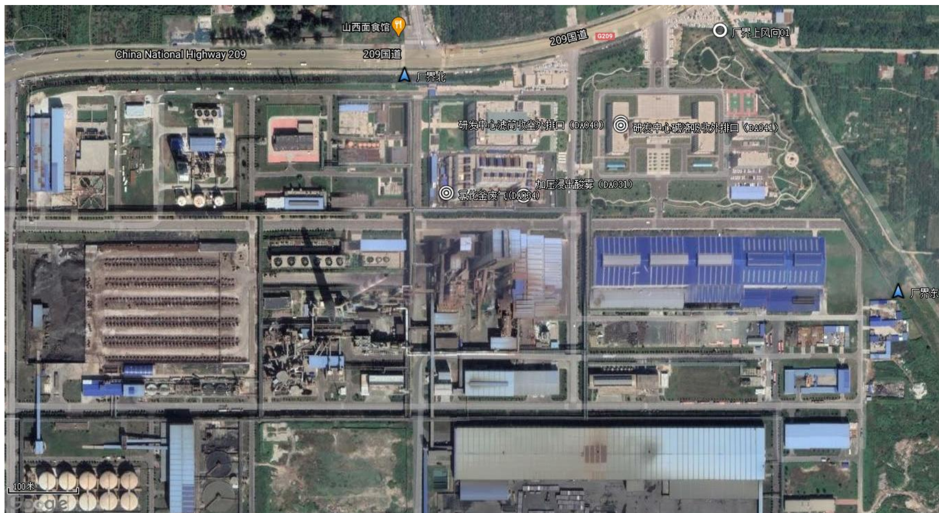
附图2-1 (1) 有组织废气监测点位布置图