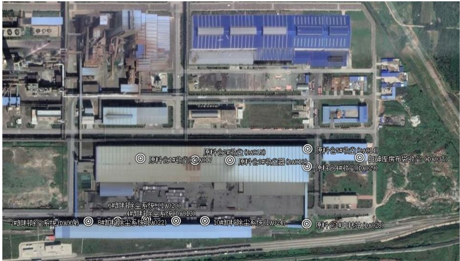
附图2-1 (3) 有组织废气监测点位布置图